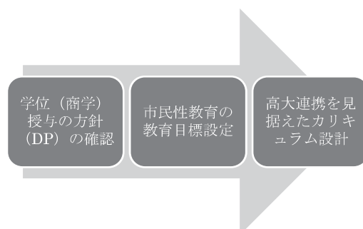
図2 大学一般教養での導入へ向けた理論

各大学においてDPを確認して、そこに「民主主義」や「主体性のある市民」、「市民性」さらには「公共性・公共」などのキーワードを掲げている大学は、こうした卒業方針を教育目標として、逆向き設計の教育を実践していくことが必要である。